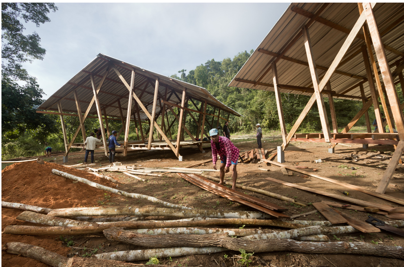
Gyaw Gyaw i gang med sovesaler tilsvarende de vi bygget sammen med Agora for CDC school i 2012, men med tilpasninger for langsiktig bruk og justeringer etter tilbakemeldinger fra fornøyde brukere.

Det største prosjektet, Kler Deh High School, som Gyaw Gyaw jobbet med i store deler av fjoråret, vil fortsatt være et stort og viktig prosjekt i 2015. Første byggetrinn, med tilhørende sovesaler, og toaletter ble ferdigstilt før jul, og vi starter året med å lage adobestein til en tilsvarende skolebygning med tre klasserom. Vi skal også få på plass ytterligere toaletter og kjøkken, og har som målsetning å ferdigstille prosjektet i sin helhet til skolestart i juni.