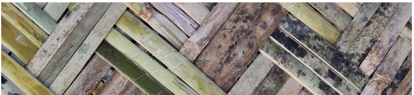
Detalj i bambus fra sovesalene i Kler Deh.

Vi har gjennomført fire større og flere mindre prosjekter i 2014. Sovesaler er bygget som fase to av Grace Garden Sustainable Learning Center, kjøkken og toaletter er bygget i tilknytning til sovesalen vi ferdigstilte i Mae Tari i fjor, og i Kler Deh har vi bygget både skole, toaletter og sovesaler. Vi har også bygget et lite lager i Noh Bo, og forsterket utearealene i Mae Tari etter regntidens herjinger. Vi har med andre ord hatt hendene fulle.