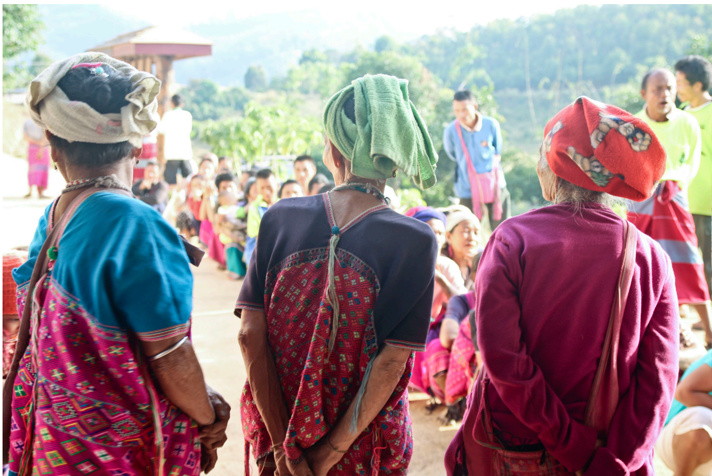
Tre av landsbyens eldre damer følger interessert med på myggnettutdeling i Pa Di Mo Jaw.

Det vil vi fortsette med i 2015, og vi er utrolig takknemlige for den jobben som gjøres i Norge.