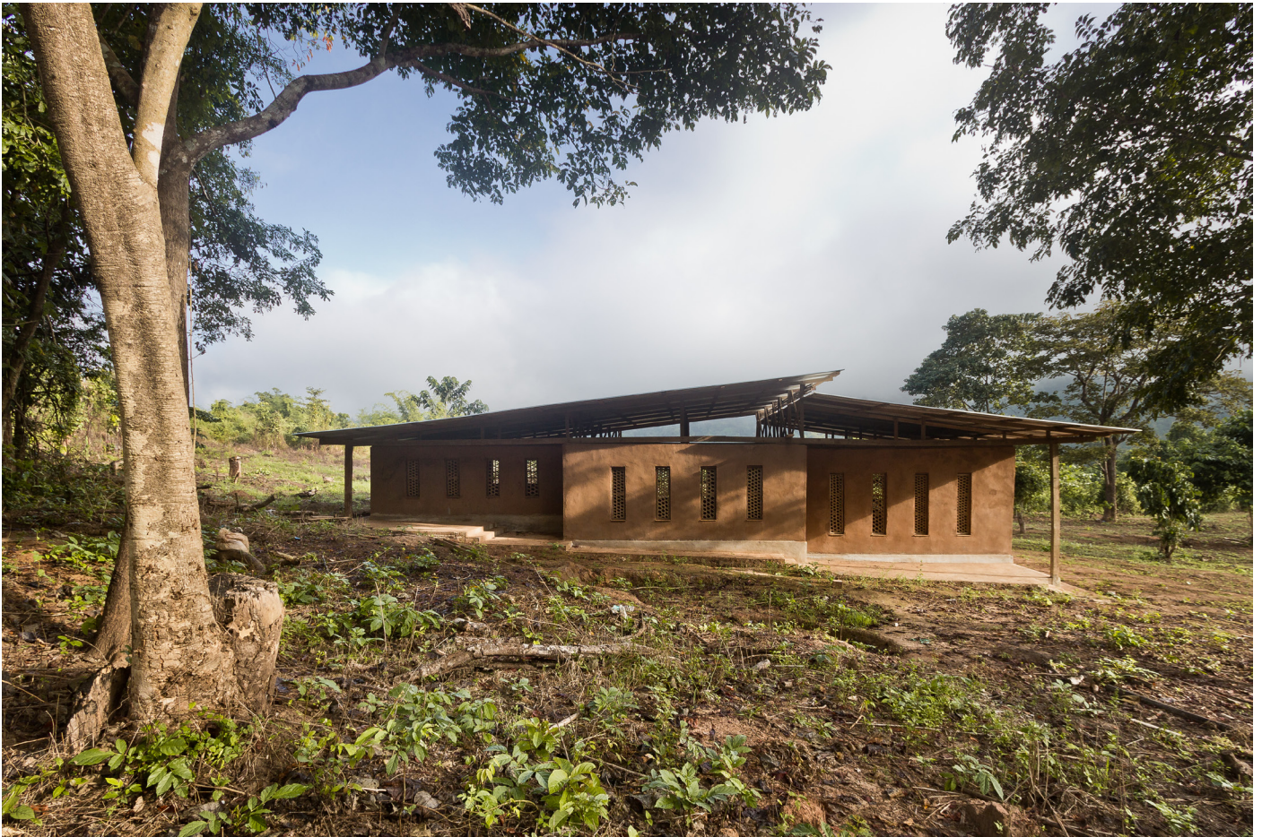
Nytt skolebygg i Kler Deh.