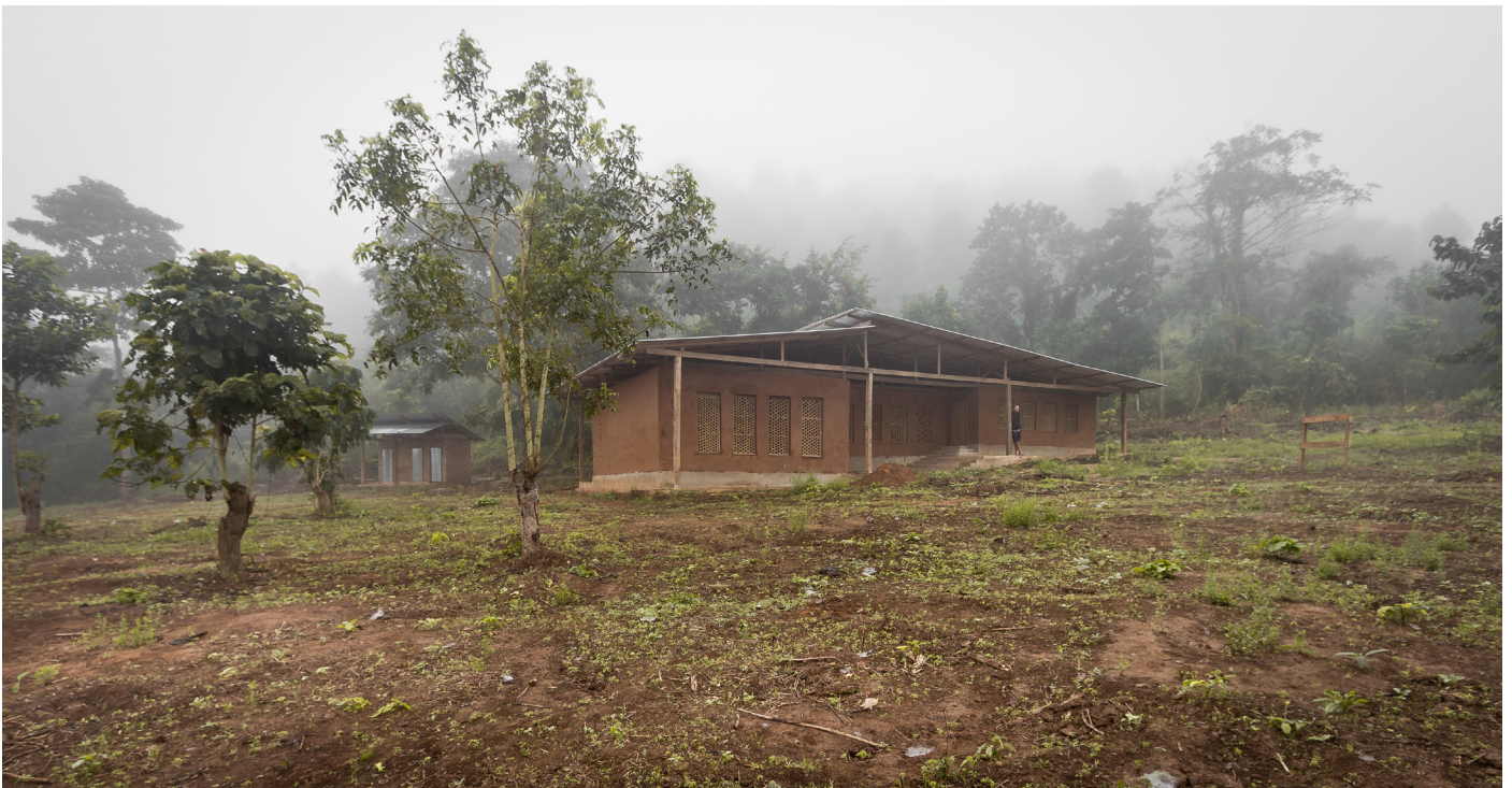
Resultatet gjennom Franc's linse.

For mer om Franc: http://outteresting.com