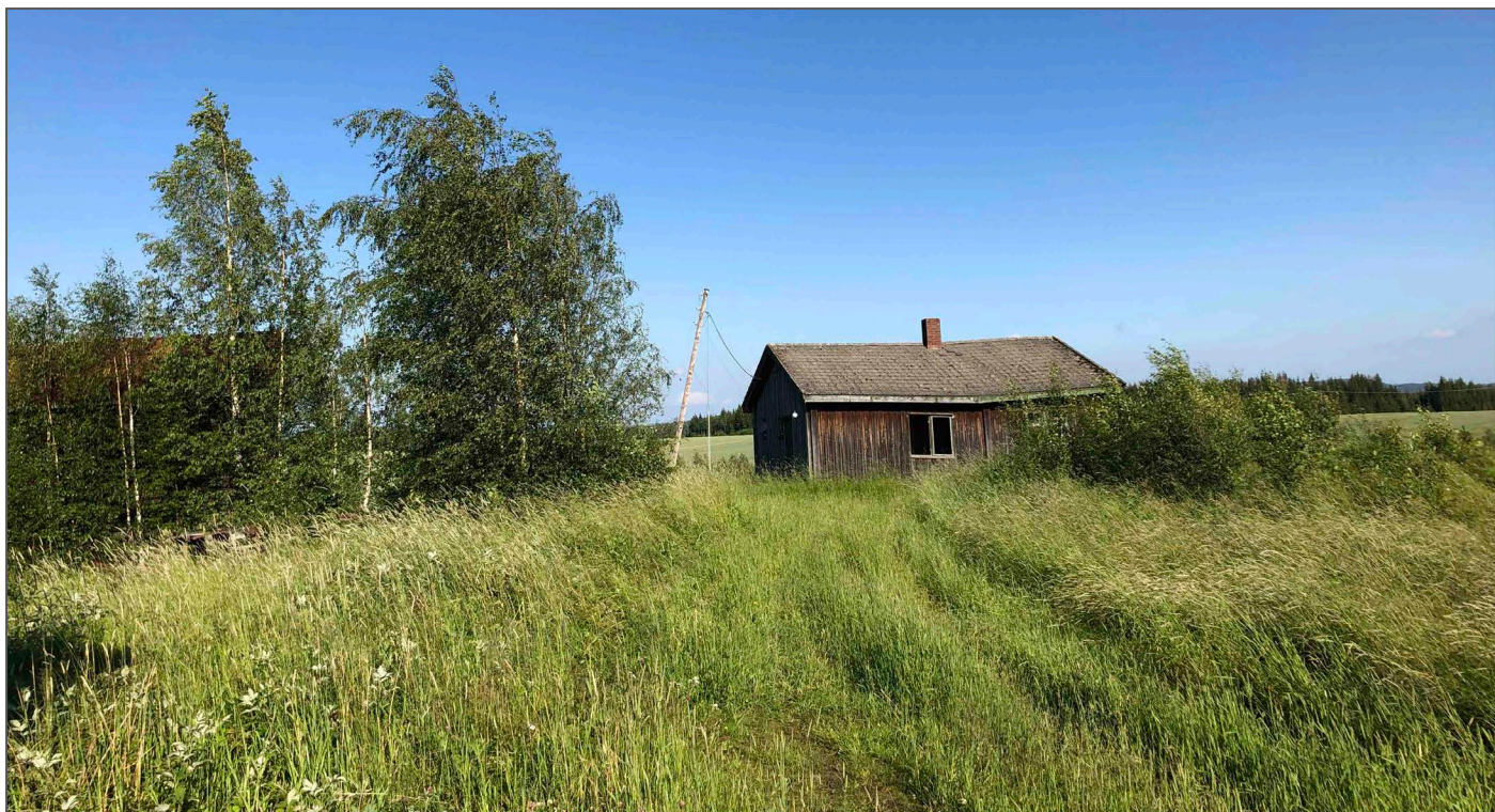
Hagenga. Nick og Lines nye hjem. Slik det så ut da vi tok over.