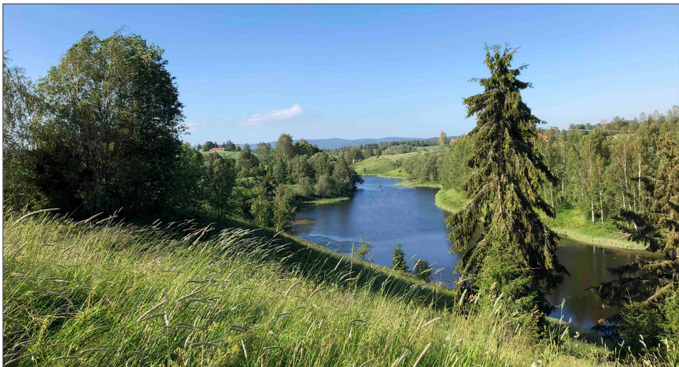
Utsikten fra gården mot Uåa som renner forbi og ut i Glomma.