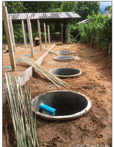
Learning by doing: Ulike løsninger frem til endelig avløpssystem.

After meeting, we make the drawings and budget together. The village leader told us to dig a big long hole then to make concrete wall. Line give us suggestion to divide in smaller rooms. We try to dig the big hole, but then after two days it rained a lot and the soil fell down in the hole. We changed our plan to concrete rings to be the toilet hole, every step of concrete ring we put on concrete block around the ring. We learn in different soil need different method to get safe and strong because the main for the whole toilet is the hole.