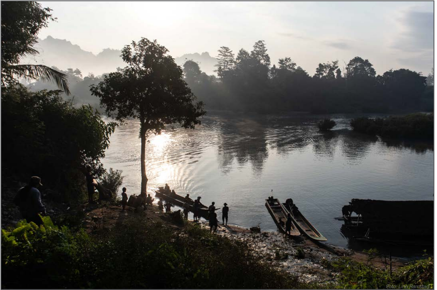
Det lokale ferjeleiet for trafikk over Moei River ved landsbyen vår