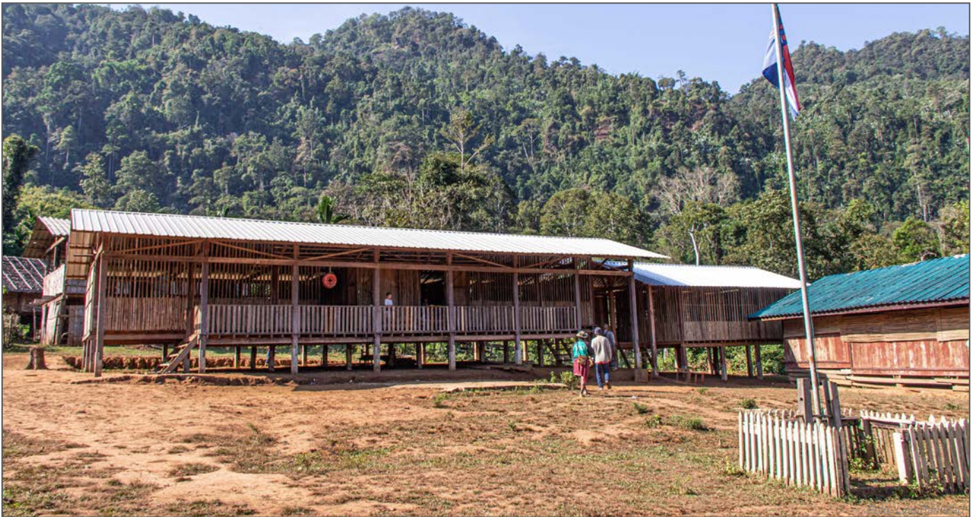
Klay Poe Klo barneskole. Det første byggetrinn ble fullført i 2018 og er selve hovedbygget. Andre byggetrinn fullført i 2019 er det frittstående klasserommet til høyre.