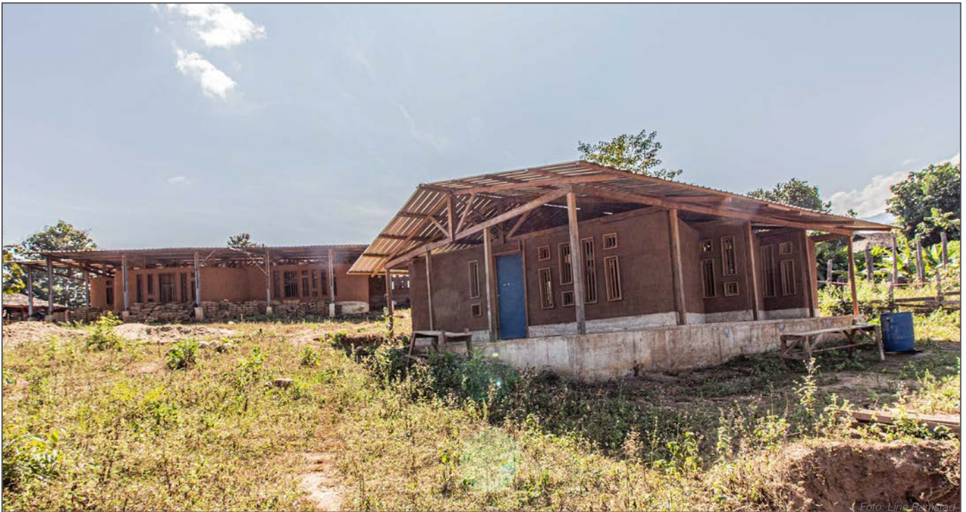
Sovesalen i forgrunnen med skolen bak.

Vi startet det første prosjektet i landsbyen Je Po Kee i 2016. Da hadde vi fulgt skolen og landsbyen over en lengre periode og det var tydelig at dette var en skole der rektor og landsbyledelsen jobbet godt sammen. Skolen er drevet av Karen Education Department som også har bidratt med tilrettelegging og innspill underveis.