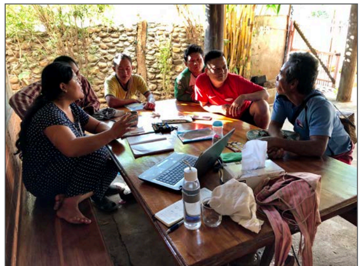
Same same, but different: Mandagsmøte på Årnes vs mandagsmøte i Noh Bo.